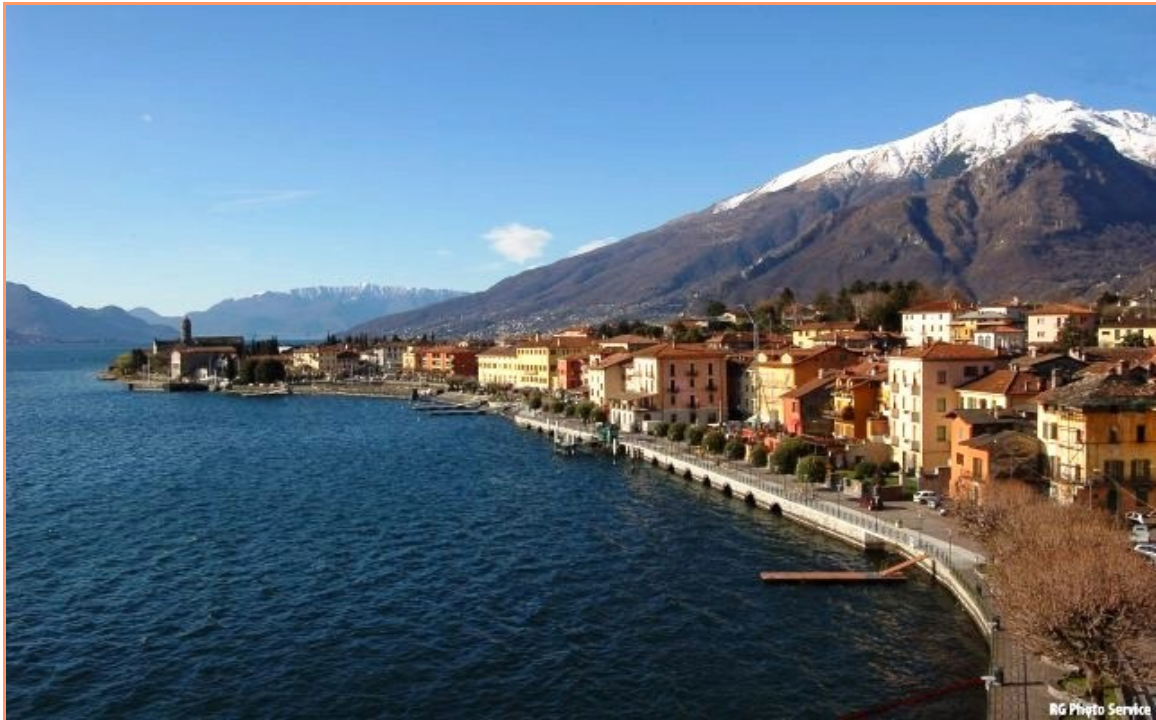
Imatge del llac de Como, a 199 metres d'altitud sobre el nivell del mar, lloc de celebració del Campionat del Món de la classe Europa

Enguany, la Llombardia italiana ha estat la regió escollida per dur a terme el Campionat del Món de la classe Europa. El llac de Como ha estat el lloc triat per a dur a terme les regates. Marc incomparable, que segons els experts va servir de paisatge de fons per a La Gioconda de Leonardo Da Vinci, ha estat les primeres setmanes de juliol l'escenari on s'ha dut a terme l'Open i el Mundial. Ha estat, concretament, la localitat de Gravedona, amb la bella església de Sta Maria de Piona, suggestiu monestir del segle XI, la que ha acollit a tots els participants.