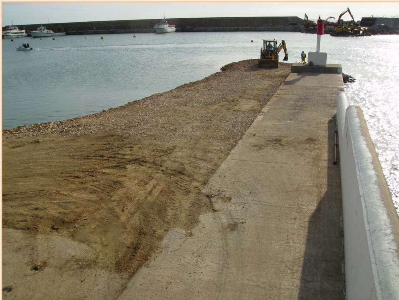
Espai guanyat al mar que ocupaven les rampes de vela lleugera.

A molt bon ritme avancen les obres d'ampliació del Port de Blanes que en l'actualitat no donen cap respir. Si al moll pesquer el treball es constant des de fa uns mesos, el pas de camions i maquinària diversa per les instal·lacions del Club de Vela Blanes fa uns deu dies ha permès entre d'altres observar el terreny guanyat al mar en 8 dies laborables a la zona on hi havia les rampes de vela lleugera.