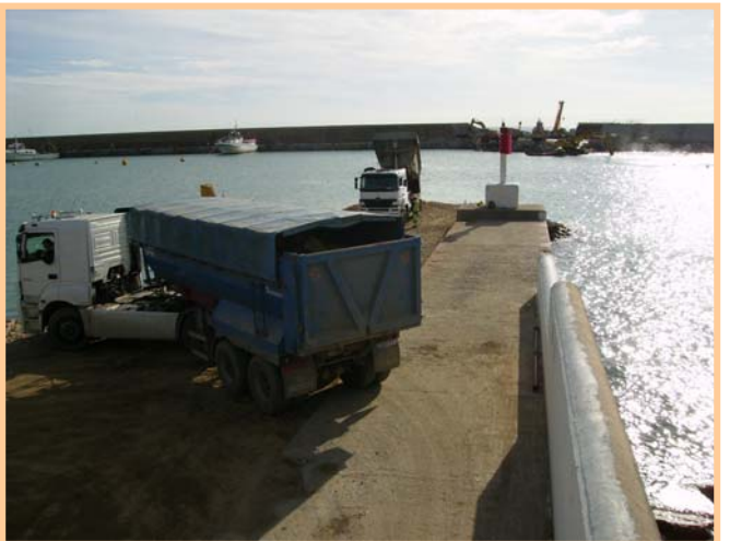
Arribada i maniobra del camions a la zona d'abocament de pedres a la BOCANA EXTERIOR