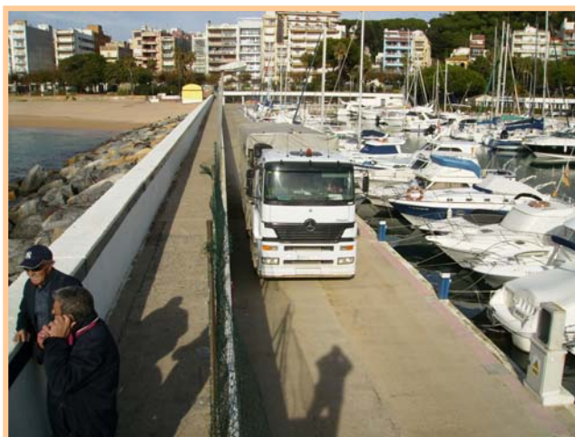
Circulació de camions al MOLL DE PONENT.