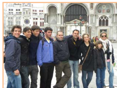
Palazzo Ducale, Gran Canal i tot l'equip del Club Vela Blanes a la Piazza de San Marcos